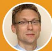
Ira Helsloot Hoogleraar Besturen van Veiligheid Radboud Universiteit Nijmegen